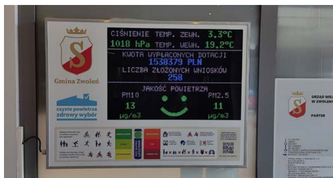
Interaktywna tablica w Urzędzie Miejskim w Zwoleniu

Kolejnym krokiem w kierunku czystego powietrza jest zainstalowanie wiosną tego roku Ekosłupka na terenie Orlika w Zwoleniu, w pobliżu miejsca rekreacji dla najmłodszych. To nowoczesne urządzenie nieustannie monitoruje jakość powietrza, a mieszkańcy mogą w każdej chwili sprawdzić aktualne wyniki. Informacje dostępne są zarówno na Ekosłupku, jak i na interaktywnej tablicy w Urzędzie Miejskim w Zwoleniu oraz dostępne pod adresem: https://ekoslupek.pl/mapa/ . Co więcej, każdy zainteresowany może zeskanować kod QR smartfonem i uzyskać szczegółowe dane z urządzenia.