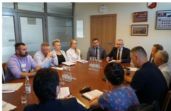
W spotkaniu uczestniczyli przedstawiciele zwolenńskich firm: Brat-Met Sp. z o.o., Spółdzielni Mleczarskiej „Mlekol” – Zakładu Przetwórstwa Mlecznego oraz Zakładu Garbarskiego Maltan.