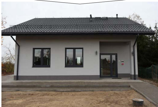
Budynek świetlicy po zakończeniu prac

Roboty budowlane ostatniego etapu zadania obejmowały docieplenie ścian i dachu, nową elewację, a także szereg prac wykończeniowych wewnątrz budynku, jak: tynki, wylewki, montaż płyt gipsowych, drzwi wewnętrznych, glazury i terakoty. Zainstalowano również nowoczesne systemy grzewcze, sanitarne, kanalizacyjne, wentylacyjne oraz panele fotowoltaiczne.