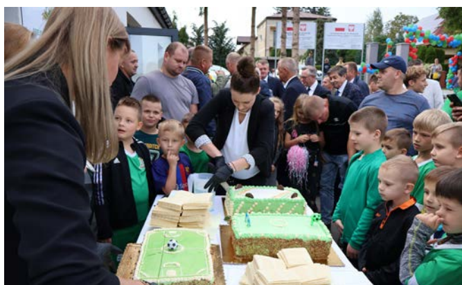
Doskonałym dopełnieniem wydarzenia było podzielenie wśród mieszkańców przygotowanego na tę okoliczność tortu.