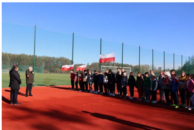
Obchody rozpoczęły się w czwartek, 9 listopada, kiedy na nowo otwartym stadionie miejskim odbył się VIII Bieg Niepodległości. Uczestniczyli w nim uczniowie szkół podstawowych z Paciorkowej Woli i Zwolenia, demonstrując sportowego ducha i patriotyzm.

W ramach uroczystości związanych ze 105. rocznicą odzyskania przez Polskę niepodległości, miasto Zwolenie przekształciło się w centrum patriotycznych wydarzeń, łączących sport, edukację i kulturę.