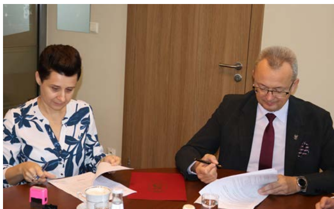
Burmistrz wspólnie z skarbnikiem gminy parafowali umowę na kompleksową przebudowę ul. Sportowej na odcinku 554 metrów bieżących.

2 października w siedzibie Urzędu Miejskiego w Zwoleń miało miejsce wydarzenie o kluczowym znaczeniu dla infrastruktury obiektu sportowo-rekreacyjnego nad zwoleńskim zalewem.