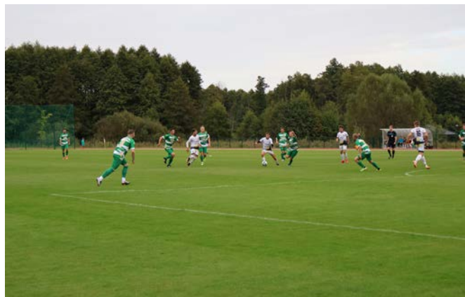
Na zakończenie rozegrany został mecz klasy A pomiędzy drużynami: Zwolenianka Zwolen – Energia II Kozienice.