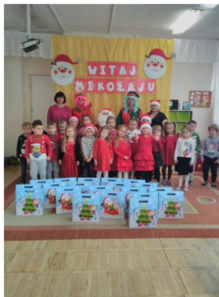
Uroczystość bożonarodzeniowa „Bóg się rodzi” w Publicznym Przedszkolu nr 1 w Zwoleniu.

Wizyta Św. Mikołaja w naszym przedszkolu to jeden z najbardziej oczekiwanych przez dzieci dni w roku. W dniu 6 grudnia Św. Mikołaj wraz ze swoimi pomocnikami odwiedził dzieci ze wszystkich grup. Dzieci z ogromną radością przywitały niezwykle gościa śpiewając mu piosenki i recytując wiersze. Oprócz pełnego worka prezentów Mikołaj przywiózł ze sobą dużo uśmiechu. Rozmawiał z dziećmi, zachęcał ich, aby były grzeczne, słuchały, rodziców i pań w przedszkolu. Natomiast każde dziecko złożyło Mikołajowi obietnice, iż kolejny rok będzie grzeczne. Na zakończenie Św. Mikołaj wszystkim przedszkolakom osobiście wręczył prezenty oraz na ręce pań wychowawczyń prezenty grupowe