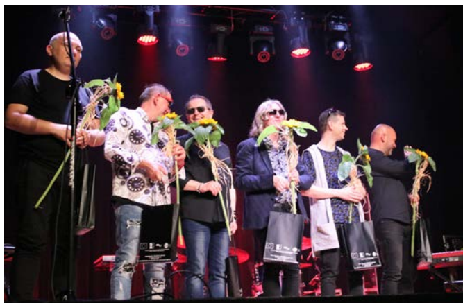
Koncert zespołu UNIVERSE

Nasze stowarzyszenie jest tzw. lokalną grupą działania, których w Polsce jest około 300. LGD działa na rzecz integracji i aktywizacji mieszkańców oraz rozwoju regionu przy zachowaniu jego tradycji, dziedzictwa i kultury. Na ten cel do tej pory udało się pozyskać Stowarzyszeniu grubo ponad 30 mln zł. Pieniądze pochodziły ze źródeł zewnętrznych, w tym zdecydowana większość (99%) ze środków UE. Dzięki tej pokażnej kwocie powstały nowe i rozwinęły się już istniejące przedsiębiorstwa, doinwestowano publiczną infrastrukturę turystyczną, sportową i rekreacyjną. Ponadto wydano kilkadziesiąt tysięcy publikacji i zorganizowano szereg ciekawych wydarzeń kulturalnych, rekreacyjnych i sportowych.