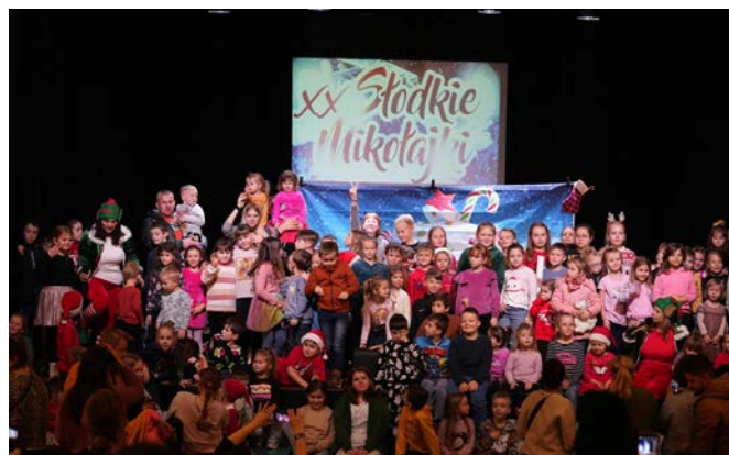
Pierwsza część świętowania pn. "XX Słodkie Mikołajki" rozpoczęła się 2 grudnia w Kinie Świt, gdzie Dom Kultury zorganizował wzruszający spektakl „Pierwsza Gwiazdka”.

Na scenie ożyły postacie elfów - Pączusi i Gwiazdeczki, których przygoda w pakowaniu prezentów i przygotowywaniu ozdób zafascynowała młodą publiczność. Kinowa sala zamieniła się w krainę wesołych zabaw. Dzieci wraz z rodzicami tańczyły i bawiły się w najlepsze, a atmosfera była pełna dobrego humoru. Każdy mały uczestnik wydarzenia otrzymał słodki upominek, a wydarzenie odbyło się dzięki hojności sponsora, Banku Spółdzielczego w Zwoleniu.