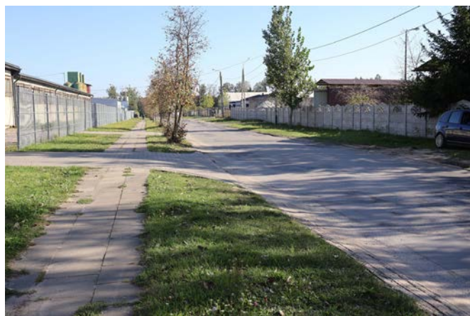
Ulica Sportowa obecnie

– Podpisana umowa na przebudowę kolejnej drogi to istoty krok naprzód w realizacji ambitnych planów rozwojowych Zwolenia – podsumowuje zastępca burmistrza Grzegorz Molendowski.