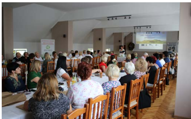
Konferencja „LGD – sukcesy, wyzwania, perspektywy”

Obecnie Stowarzyszenie „Dziedzictwo i Rozwój” skupia swoje działania na finalizacji realizacji Lokalnej Strategii Rozwoju na lata 2014-2020. Lokalna Strategia to taki bardzo ważny dla nas dokument, ponieważ niejako wytycza on nasze kierunki działań. Do tej pory Stowarzyszenie opracowało 3 takie strategie- 2007-2013, 2014-2020 i nowa, niedawno oceniona (II miejsce w województwie mazowieckim) 2023-2027. Wdrażanie lokalnej strategii rozwoju w ramach trwającej jeszcze perspektywy kończymy z wynikiem zadowalającym, w mojej ocenie. PROW 14-20 na naszym obszarze to miliony euro, które trafiły na teren południowego Mazowsza, to setki projektów, dziesiątki nowych miejsc pracy, rozwiniętych przedsiębiorstw, nowoczesna infrastruktura dla mieszkańców i turystów. To także spełnione marzenia, zrealizowane pomysły, znaczna poprawa jakości życia na obszarach wiejskich. Tyle superlatyw. Ponieważ wdrażanie lsr to też nazbyt rozbudowana biurokracja, sterty dokumentów, interpretacji, długi czas oczekiwania na wiążące decyzje- tego chcielibyśmy uniknąć w przyszłości.