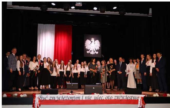
Młodzież przypomniała o najważniejszych wydarzeniach historycznych, które tworzyły swoistą drogę Polaków do wolności. Wzruszające przedstawienie, pełne ducha patriotyzmu, zostało nagrodzone gromkimi brawami.

Dalsza część uroczystości przeniosła się do zwoleńskiego Kina Świt, gdzie przedstawiony został program patriotyczny „Leć orle biały nad polską ziemią” w wykonaniu uczniów Zespołu Szkół Rolniczo-Technicznych im. Bohaterów Walki z Faszyzmem w Zwoleniu.