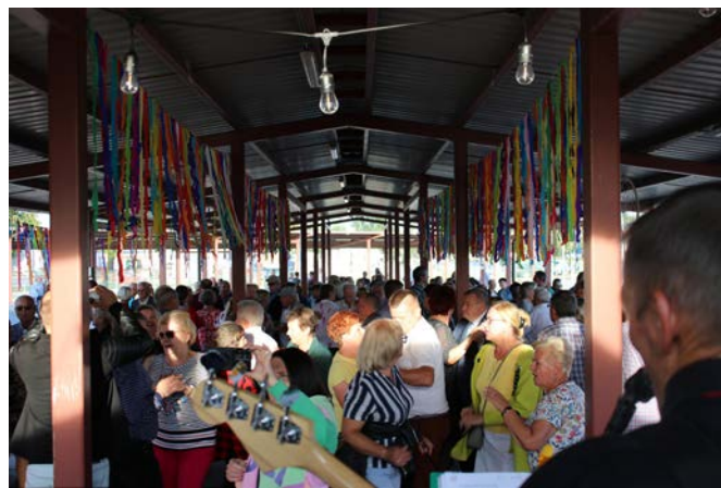
Potańcówka Folk Party w Jedlni-Letnisku

Oczekiwania względem rozwoju lokalnego kierowanego przez społeczność na najbliższe lata dotyczą m.in. zagadnień- zrównoważonego rozwoju ekonomicznego, poprawy dostępu do infrastruktury publicznej, ochrony środowiska, partnerstwa i szeroko pojętej współpracy. To wszystko zawarte jest w naszej strategii, zgodnie zresztą z oczekiwaniami mieszkańców obszaru, z którymi dokument był wielokrotnie konsultowany na etapie powstawania. Liczę, że za rok o tej porze nasza lokalna grupa działania będzie efektywnie wdrażać nową strategię i za naszym pośrednictwem kolejne środki finansowe trafią do mieszkańców LGD, organizacji pozarządowych z terenu, przedsiębiorców i samorządów. Finalnie pozwoli to na kolejne inwestycje, na realizację ciekawych inicjatyw i wydarzeń, na które już dziś Państwa zapraszam.