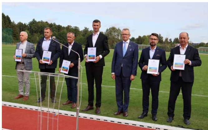
Włodarz miasta wręczył też pisemne podziękowania dla osób zaangażowanych w przebudowę stadionu.