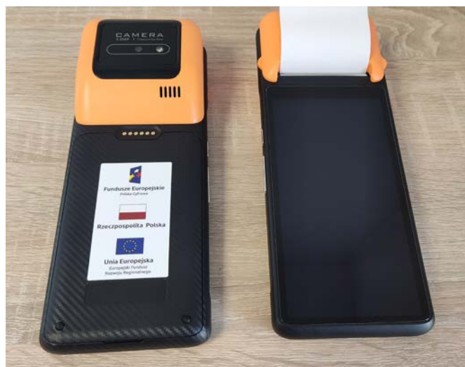
Terminale do obsługi aplikacji ZONE.App

gawczego SYSLOP. Dzięki niemu mieszkańcy będą na bieżąco informowani o stanie powietrza w ich regionie, co pozwoli na świadome podejmowanie decyzji dotyczących aktywności na świeżym powietrzu.