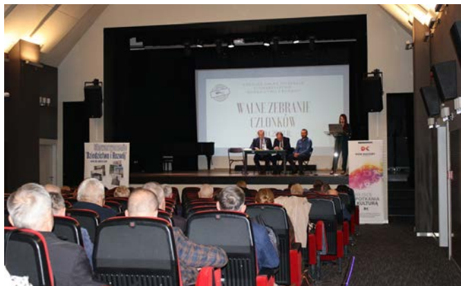
Walne Zebranie Członków Stowarzyszenia Dziedzictwo i Rozwój

kalny Kierowany przez Społeczność. Serdeczne podziękowania kieruję do Zarządu, członków LGD, władz samorządowych, wnioskodawców, lokalnych liderów, którzy wsparli i wciąż wspierają realizację Lokalnej Strategii Rozwoju, tym samym przyczyniając się do wspólnych sukcesów w rozwoju obszarów wiejskich.