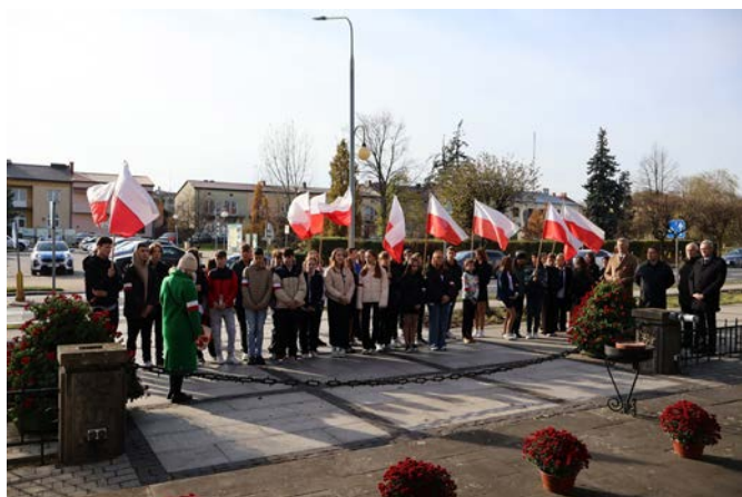
Podczas przemarszu zapalono znicze przy najważniejszych miejscach pamięci narodowej w Zwoleniu. Był to moment refleksji i hołdu dla tych, którzy przyczynili się do odzyskania niepodległości Polski.