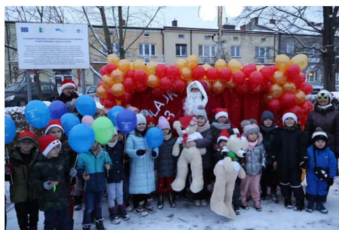
Pamiątkowe zdjęcie uczestników konkursu z Mikołajem.