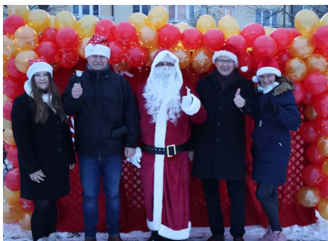
Pomocnicy Świętego Mikołaja

Prace małych artystów można podziwiać w czytelnicy Miejsko-Gminnej Biblioteki Publicznej w Zwoleniu aż do końca grudnia, co jest wspaniałym dopełnieniem świątecznej atmosfery w mieście.