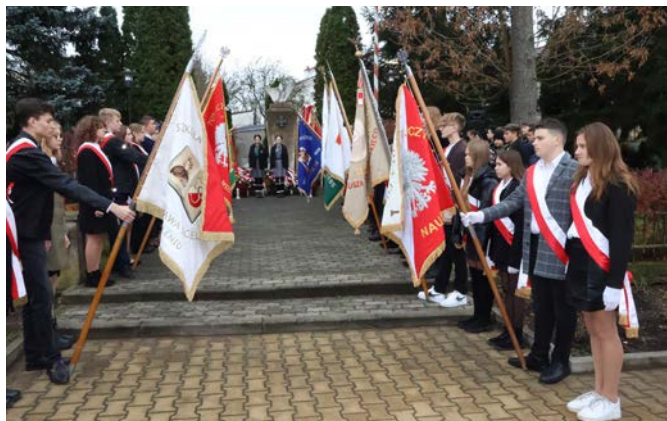
Przy pomniku Nieznanego Żołnierza oprócz warty harcerzy ustawione zostały także liczne poczty sztandarowe.