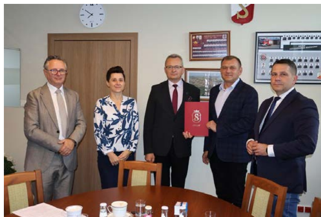
Wykonawcą zadania będzie lokalne Przedsiębiorstwo Robót Drogowych Sp. z o.o.

– Ulica Sportowa jest nie tylko drogą dojazdową do firm, ale również istotnym elementem kompleksu sportowo-rekreacyjnego nad zalewem, stanowiącym kluczowy dojazd do tego miejsca. Zalew to miejsce wypoczynku mieszkańców oraz organizacji dużych imprez plenero-