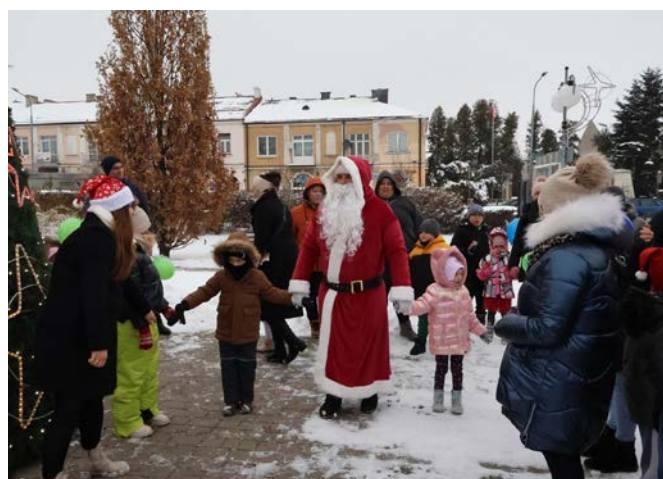
Spotkanie przy choince na Placu Kochanowskiego obfitowało w dobre humor, wesołą muzykę, wspólny taniec i niezapomnianą zabawę.