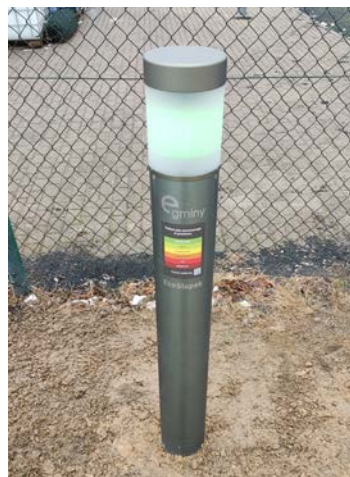
Ekostupek na terenie Ortika

Dzięki temu możliwe jest monitorowanie, czy mieszkańcy nie palą szkodliwych, zakazanych materiałów w swoich urządzeniach grzewczych. Próbkę są wysyłane do akredytowanego laboratorium, z którym podpisano umowę już w 2021 roku, co gwarantuje ich rzetelną analizę i pozwala szybko reagować na ewentualne nieprawidłowości.