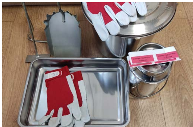
Gmina Zwolen w minionym roku wyposażyła się w odpowiedni sprzęt i przeszkoliła trzech pracowników do pobierania próbek popiołu.

Dzięki temu możliwe jest monitorowanie, czy mieszkańcy nie palą szkodliwych, zakazanych materiałów w swoich urządzeniach grzewczych. Próbkę są wysyłane do akredytowanego laboratorium, z którym podpisano umowę już w 2021 roku, co gwarantuje ich rzetelną analizę i pozwala szybko reagować na ewentualne nieprawidłowości.