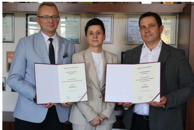
Samorząd gminy na przebudowę dwóch ulic pozyskał blisko 4,5 miliona złotych.

Na ulicy sportowej mieszkańcy Zwolenia mogą spodziewać się kompleksowej przebudowy. Projekt zakłada wykonanie nowej podbudowy oraz nawierzchni z beto-