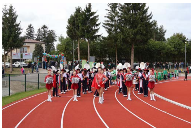
Oficjalne otwarcie stadionu rozpoczęło się przemarszem sportowców MKS Zwolenianka Zwolen, prowadzonych przez Młodzieżową Orkiestrę Dętą Miasta Zwolenia po nowej bieżni obiektu.