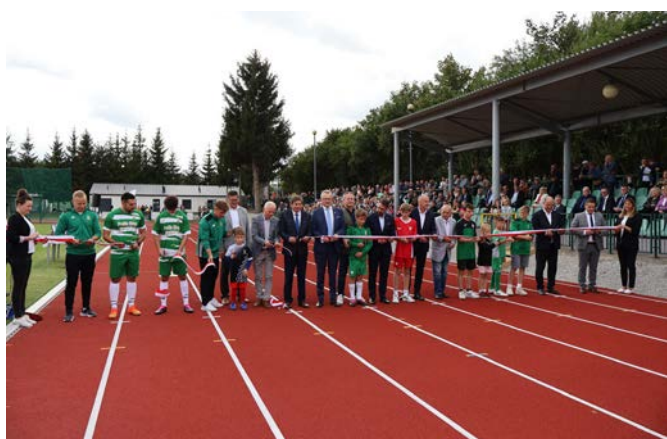
Przy tak ważnej uroczystości nie mogło zabraknąć symbolicznego przecięcia wstęgi, oficjalnie otwierającego obiekt.