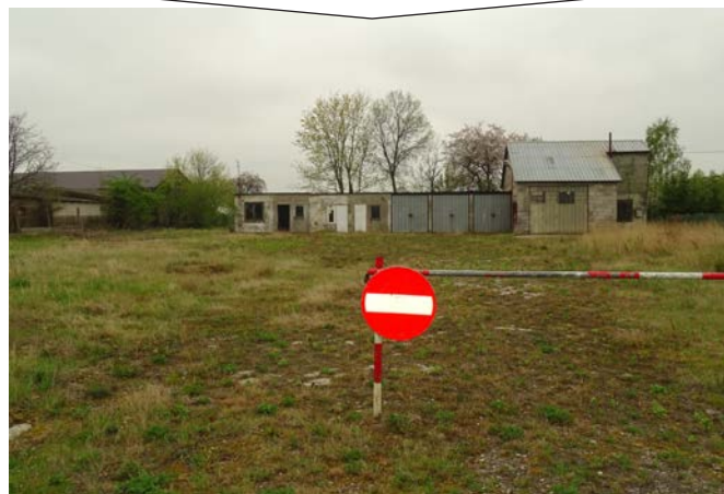
Budynek świetlicy przed rozpoczęciem prac

Dodatkowo w ramach projektu wykonano prace zewnętrzne, w tym opaskę wokół budynku oraz taras ze schodami i podjazdem dla osób z niepełnosprawnością. W efekcie końcowym dotychczas prowadzonych tu robót powstał jednokondygnacyjny obiekt, który nie tylko zachwyca nowoczesnością, ale jest także idealnie dopasowany do potrzeb mieszkańców Atalina.